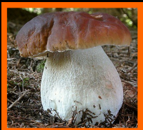
BOLETUS Boletus edulis