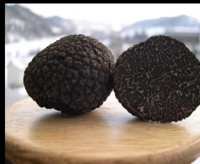
TRUFA NEGRA* Tuber melanosporum