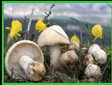
BUJARDON Calocybe gambosa