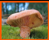
NISCALO Lactarius deliciosus