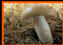
LLANEGA BLANCA Hygrophorus gliocyclus