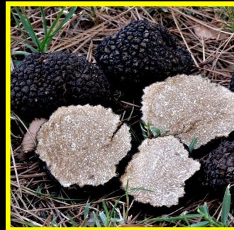
TRUFA DE VERANO* Tuber aestivum