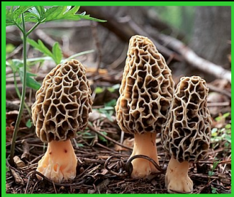
COLMENILLA Morchella conica